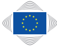
European Committee of the Regions

Bashkimi Evropian është një qeverisje shumë nivelëshe dhe si i tillë ai përfshin shumë aktorë në procesin politikbërës. Pushteti vendor nuk ka një status të veçantë në organizim politik të BE, megjithatë ashtu sikurse dhe parashikojnë Traktatet, BE është kujdesur të përfshijë në mënyrë direkte dhe indirekte pushtetin vendor në procesin e saj politik-bërës. Tashmë janë krijuar mekanizmat dhe strukturat që zëri i pushtetit vendor të arrijë jo vetëm nëpërmjet vendeve anëtare, por edhe drejtpërdrejtë në politike-bërjen e BE. Komunikimi i drejtpërdrejtë i pushtetit vendor me strukturat politike të BE realizohet nëpërmjet Komitetit Evropian të Rajoneve (KiR). KiR është strukturë konsultative por me një rol të qartë në procesin vendimmarrës në BE. (KiR) përbëhet nga 350 anëtarë - përfaqësues të zgjedhur në nivel lokal për një mandat 5-vjeçar. Konkretisht anëtarët e KR të cilët emërohen si përfaqësues rajonal dhe të njësisive vendore me zgjedhje të drejtpërdrejta nga qytetarët